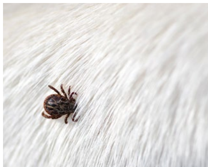
Zecken können sowohl für Hunde als auch für Menschen gefährlich werden.

Die Symptome sind respiratorisch, betreffen also die Atmung. «Schnel-